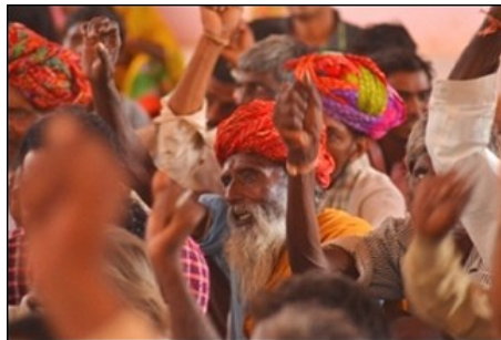
Réunion publique, Rajasthan, 7 juillet

été vendue entre 2 et 4 millions de Roupies aux entreprises. Les agriculteurs qui n'ont pas été expulsés ne peuvent pas irriguer leurs champs, car l'eau du barrage est fournie aux industries. Ceux qui ont osé protester contre cette situation se sont vus chargés de fausses accusations par le gouvernement.