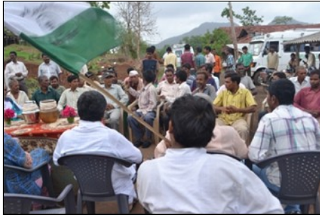
Réunion avec la yatra, Gujarat, 20 Juin 2012

Promoting non-violence and Rights to land & livelihood | Mobilizing for the March Jan Satyagraha 2012 | October 2011 - September 2012