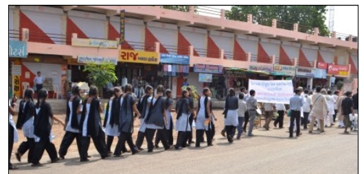
Etudiants participant à la une marche avec la Jan Samvad Yatra, Gujarat, 17 juin 2012

Des militants en prison. Dans le district de Dang, comme dans d’autres régions de l’Inde, les autorités tentent de discréditer et de stopper les militants en